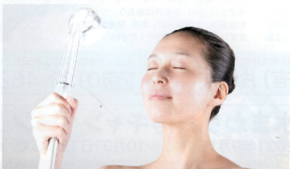
▲ふんわりミストの使用後、肌のもちもち感を実感できます

洗顔フォームを使っていないのに、ミストだけでツルツルサラサラ体験できます。多くのモデルも愛用するなど女性には欠かせない美アイテムでは？勢いのあるストレートより微細な気泡を毛穴まで届けるミストに、ワンタッチで切り替えて使える今話題のシャワーヘッドです。ウルトラファインバブルを含んだ洗浄力の高い超微細空気混合水を作り出し、上質な肌感触を実現しています。