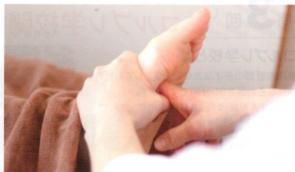
▲他にも腸活・ダイエット・ファスティングアドバイスもあり

ハピネスの足つぼの施術法は、県内唯一の婦人科系不調の改善を目指す足つぼです。子宮筋腫・子宮内膜症・生理痛・貧血・PMS・冷え・妊活などの婦人科系の不調を足つぼや食事、よもぎ蒸しなどの自然療法で快適な毎日を過ごせるようケアをします。仕事や家事で慌ただしい毎日です。自分と見つめ合う時間を作ってみませんか？足つぼで女性の体質改善を相談してみたいですか？