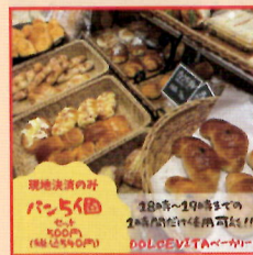
DOLCEVITAベーカリー パン5個セット500円チケット 5名様