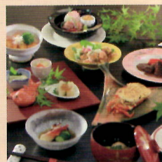
グランドール四季亭 1,000円分お食事券 5名様

コルプレLINE@の応募フォームからご登録いただき、トーク画面にお名前、ご住所、ご希望の賞品をご入力ください。10月末日までにご応募いただいた方から厳正な抽選を行い、当選者を決定いたします。なお、ご応募の際にいただいた個人情報は、ご応募いただいた賞品の抽選、発送にのみ使用させていただきます。その他の目的には使用しません。