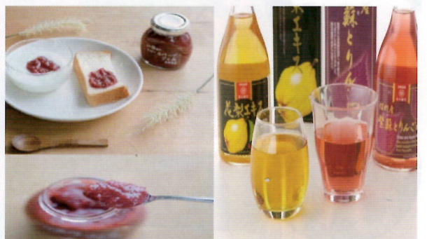
▲国内でも希少なルバーブジャムとさっぱりドリンク

長野県産原料を使用し、身体に優しい無添加製法にこだわり製造しています。多くの商品からこの時期のイチオシは、信州産のルバーブジャム、ドリンクタイプのリンゴ酢がおすすめです。あまり聞き慣れないルバーブとは、酸味が強い植物で身体の免疫力を高めたり、むくみ解消、デトックス効果も期待されます!食べやすいように甘みをプラスしたジャムです。