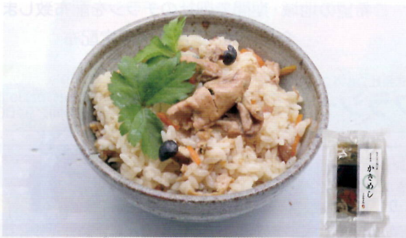
▲食品添加物不使用!!たこ釜めし、かき釜めしの素

白米と釜めしの素を入れて炊飯器のスイッチを押すだけ。簡単なのにまるで本格的なお店の味を頂けます。三重県産のたこや牡蠣といっしょに、たくさんの国産野菜もセットになっているので、野菜嫌いなお子様をお持ちのママさんにも大人気の商品です。他にも、自社製造の伊勢名物松阪牛を使用したローストビーフや鶏ハムなどもおすすめです。