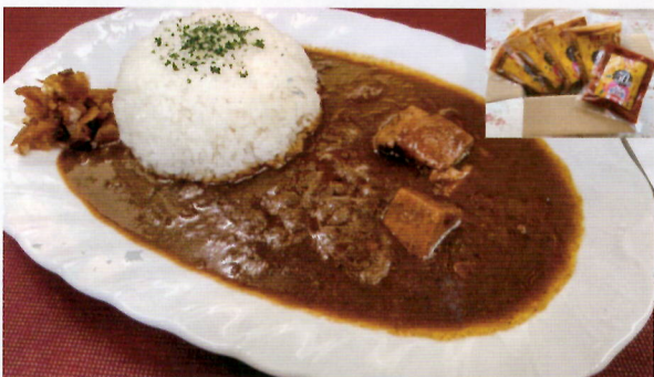
▲昭和レトロな懐かしい味のポークカレー

カレーの辛さの段階が、1倍(普通の辛さ)、3倍(ちょっと辛い)、5倍(辛い)、10倍(極辛い)、50倍(極極極辛い)と選べます。ショウガ、ニンニクなど多くのスパイスと、じっくり5時間位かけて炒めた玉葱、豚肉、パイオン生クリームを入れて、5時間程かけて煮込み、味を調え仕上げた絶品カレーです。どこか懐かしさを感じさせてくれ、くせになる美味しさが特徴です。