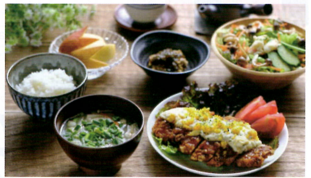
▲毎日変わる献立にワクワクしていた子供の頃を思い出すメニュー

「サクッと」とは、時間をかけず夕食の準備。「まかない」とは食のプロが毎日スタッフ用にご飯を作ること。あなたは「給食」という言葉を聞くとどんなイメージですか? 私は食べてる子どもたちの笑顔、次に献立表を思い出しました。我々は、家族の笑顔を作りたい、働きながら家事をするすべての人に時間というプレゼントをしたいと思っています。我々料理人ができることはなんだろうと考えた策(朔)です。