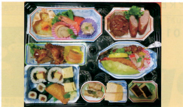
▲手づくりだからできる、心あたたまるオードブルです

バランスのいい手づくり料理は、地元の方から一目置かれる人気店です。家族の記念日などには、彩りのよいオードブルがテイクアウトできます。どこか懐かしい雰囲気のみまわり食堂は開業30年、隠れたファンも多いとか！愛犬との食事、さらにドックトレーナーの店主と、愛犬の話や愛犬へのアドバイスも楽しめます。犬用ハーネスとリードの各種取り揃えて、試着販売もできます。