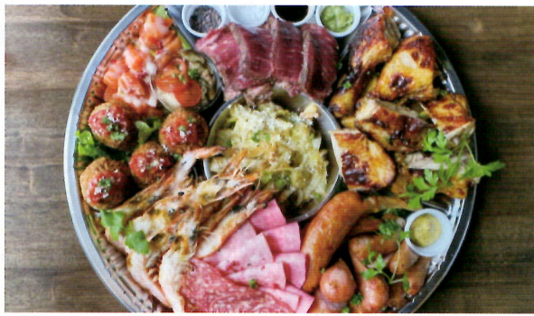
▲贅沢ステーキ&グルメが楽しめる自家製オードブル

記念日といえば友達や家族と集まり、おうちパーティーをする方も多いと思います。せっかくなら特別で、おいしいオードブルを用意して笑顔で過ごしたいですよね? グーステーブルのオードブルには、豪快に焼き上げた、グースでしか味わえない牛フィレステーキを使用しています。スペシャルな自家製オードブルで、大切なパーティーに花を添えましょう。