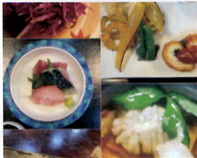
▲秋のお値打ちセット ※コルプレ学校のランチとは異なります。